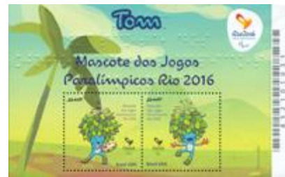
郵票小型張 (殘疾人奧運會) (BL3) $20.00