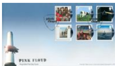
已蓋銷首日封連郵票 (自動黏貼) (BR354)