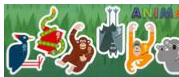
小全張 (自動黏貼) (BR355)