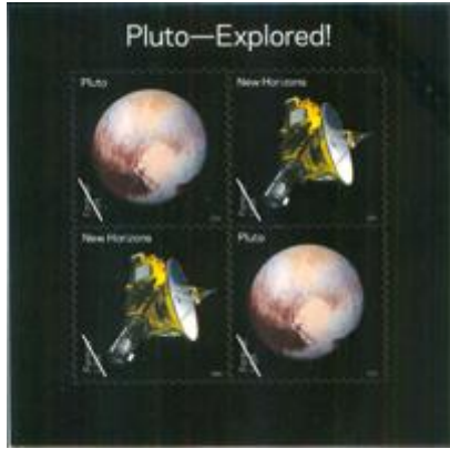
郵票小型張 (自動黏貼) (US186) $17.00