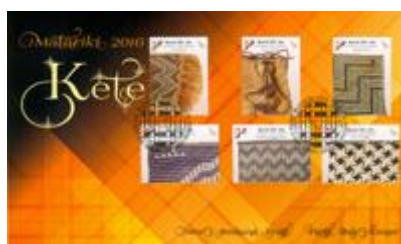
已蓋銷首日封連郵票 (自動黏貼) (NZ266)