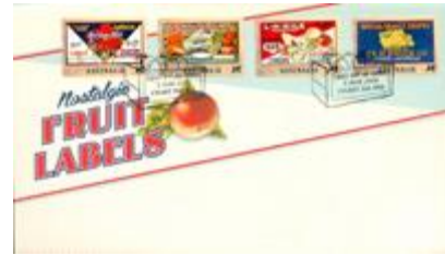
已蓋銷首日封連郵票 (自動黏貼) (AU386) $28.00