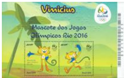
郵票小型張 (奧運會) (BL2) $20.00