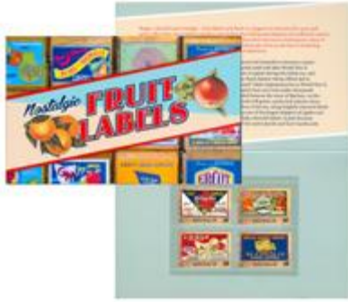
套摺 (AU385) $29.00