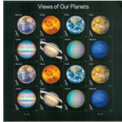
小版張 (自動黏貼) (US187) $65.00