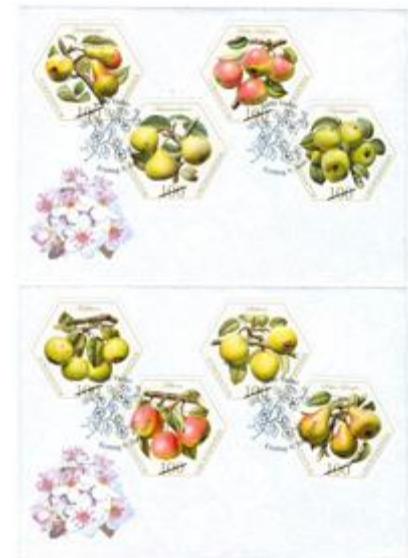
一套兩個已蓋銷首日封連郵票 (自動黏貼)(LI119) $89.00