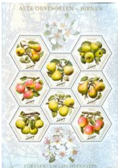
小全張 (自動黏貼) (LI118) $71.00